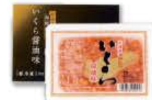
※写真はいくら250gです。 ※パッケージは変更すること もあります。